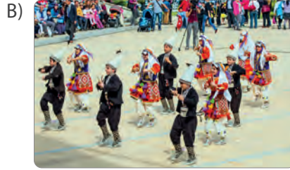
Halk oyunları grubu