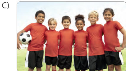
Spor takımı arkadaşları